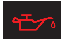
エンジンオイルランプ