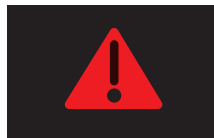
マスターウォーニング