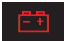
バッテリーランプ