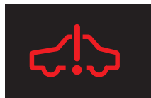
ハイブリッドシステム 異常警告灯